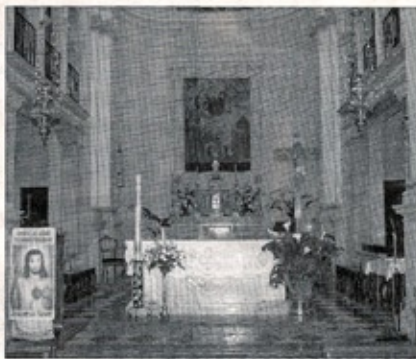
L'interno della chiesa parrocchiale di Anzano di Cappella Maggiore